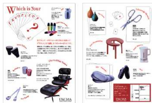
~ パンフレットデザインイメージ ~