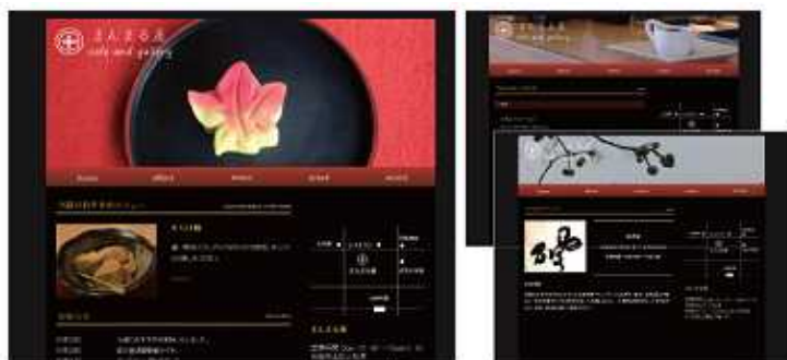
~ WEB ページデザインイメージ ~

WAVE が企業からパンフレットやロゴ、WEB ページなどのデザイン制作依頼を受託。WAVE スクールに通う受講生にデザインを公募します。集まった作品の中から、企業は優秀なデザインを採用し、実際にパンフレットなどに使用します。このしくみを利用することで、企業は無料でデザインの提供を受けることができ、受講生は学習カリキュラムでは学ぶことができない、実践的な経験を積むことができます。